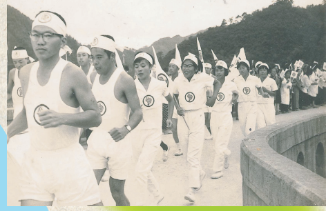
昭和38年山口国体聖火リレー(平安橋)